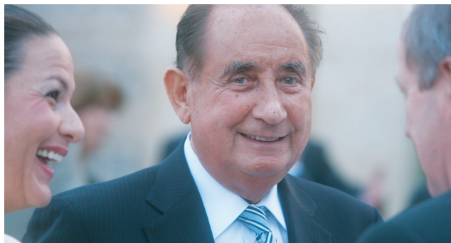
Mit den Spenden des Ehepaars Buchmann will man Fachkräfte akquirieren und den wissenschaftlichen Austausch mit Israel fördern.

Das Herz des Buchmann-Instituts für molekulare Lebenswissenschaften ist ein sechs Millionen Euro schweres Elektronenmikroskop. In dem im August feierlich eröffneten Gebäude arbeiten derzeit rund 180 Menschen