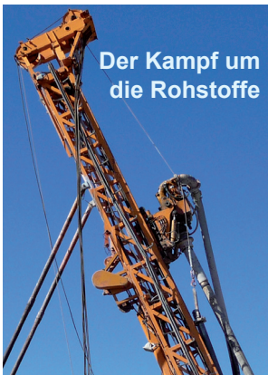
Der Kampf um die Rohstoffe