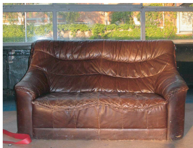
Nicht nur die legendäre Ledercouch aus dem alten KOMM wird überleben. Auch der Flipperautomat und die Discokugel werden im neuen Haus eine Erinnerung an das alte ‚Feeling‘ aufkommen lassen.

spannung. Umgeben ist das zwischen Apotheke und Spielplatz gelegene Gebäude von altem Baumbestand.