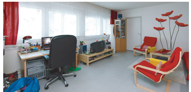
Tausende von Studierenden haben hier bereits gewohnt. Das Wohnheim ‚Ginnheimer Landstraße‘ wurde komplett saniert (Foto links) und neu eingerichtet.

An der Hansaallee entsteht derzeit ein Wohnheim mit 400 Zimmern, das zum Wintersemester 2014 bezugsfertig sein soll. Doch das reicht nicht. „Wir brauchen viel mehr.“ Vor allem, da im kommenden Jahr noch mehr doppelte Abiturjahrgänge an die Hochschulen strömen. Doch in Frankfurt gibt es wenig freie Flächen zum Bauen. Und Bauen ist teuer. Auch private Investoren setzen inzwischen auf Studenten. „Die meisten